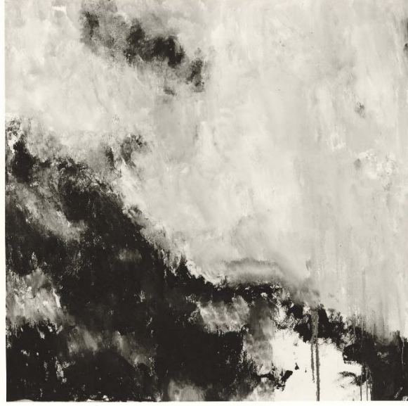
Schuldig landschap, 1987, tweeluik, olieverf, 198x198 cm (2x)

Met dank aan het Armando museum, Amersfoort