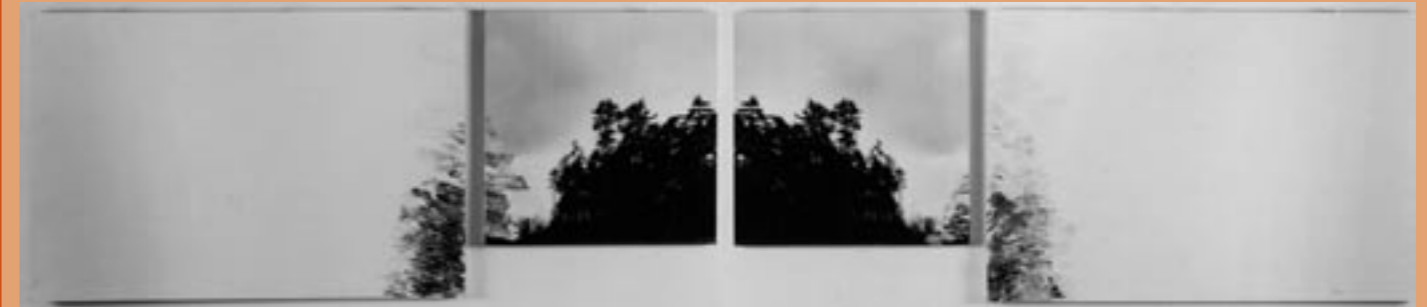
Schuldig landschap, 1977, vierluik, 2x schilderij + 2x foto op aluminium, diverse materialen op paneel, 122 x 567 cm