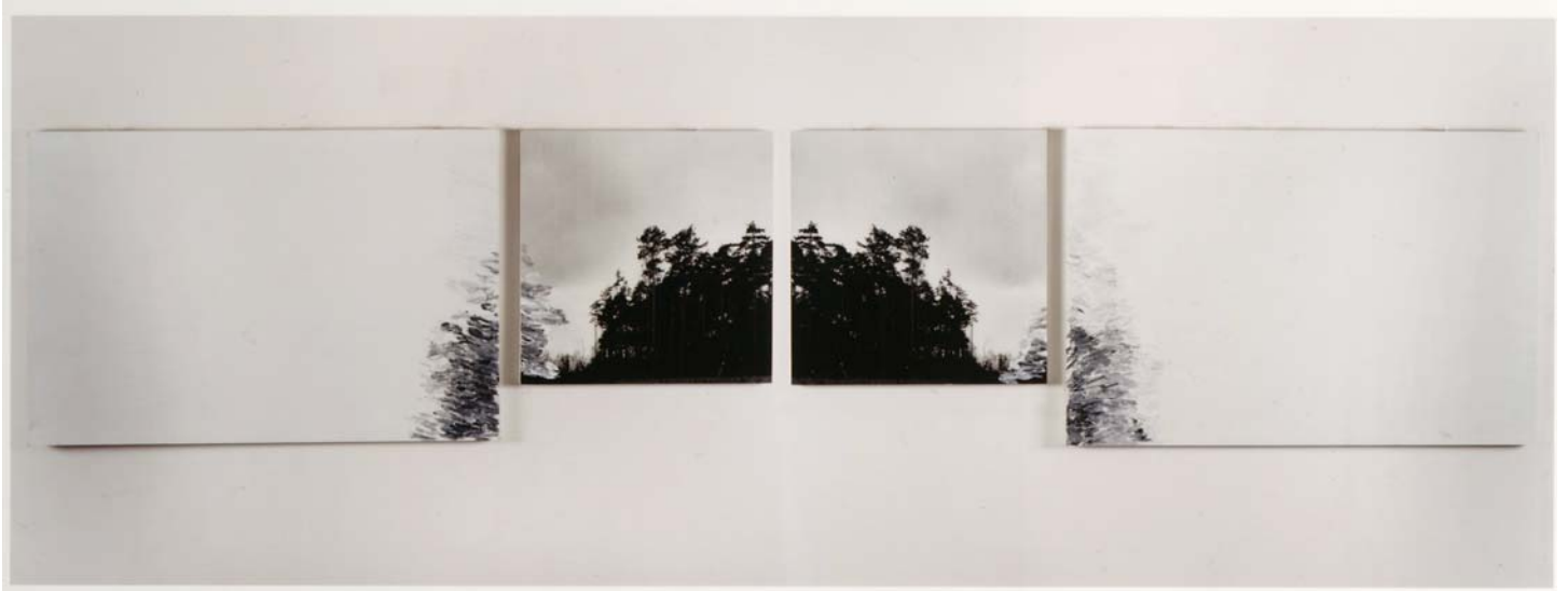
Schuldig landschap, 1977, vierluik, 2x schilderij + 2x foto op aluminium, diverse materialen op paneel, 122x567 cm Met dank aan het Armando museum, Amersfoort

Startvragen bij Schuldig landschap ; vierluik